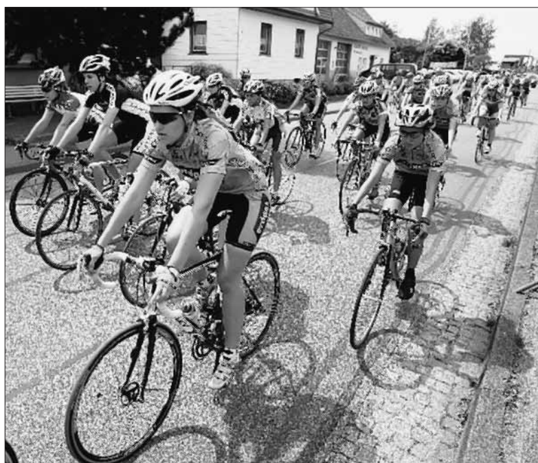
Mehrere hundert Radsportler müssen am Sonntag bei den Rennen des RSC Biberach eine neue Strecke bewältigen.

Rennen & Startzeiten 8 Uhr: Schüler U13 (3 Runden/21,6 km). 8.04 Uhr: Schülerinnen U13 und Schülerinnen U15 (3/21,6). Schüler U15 (5/36). 10.50 Uhr: Schüler und Schülerinnen U11 (1/7,2). 12.20 Uhr: Einsteigerrennen (2,5 km, verkürzte Strecke). 12.50 Uhr: Junioren U19 (10/72). 12.55 Uhr: Jugend U17 weiblich, Juniorinnen U19, Elite Frauen (6/45). 15.30 Uhr: Männer A-, B-, C-Klasse (14/100,8). 15.35 Uhr: Jugend U17 männlich (8/57,6).