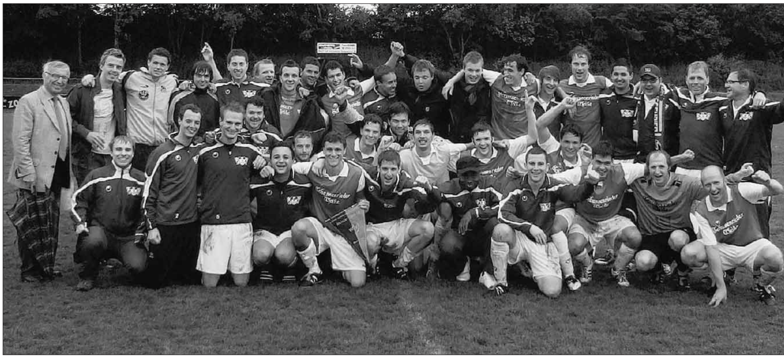
Grund zur Freude: Die Fußballer des FV Bad Schussenried sind nach vier Jahren zurück in der Landesliga.