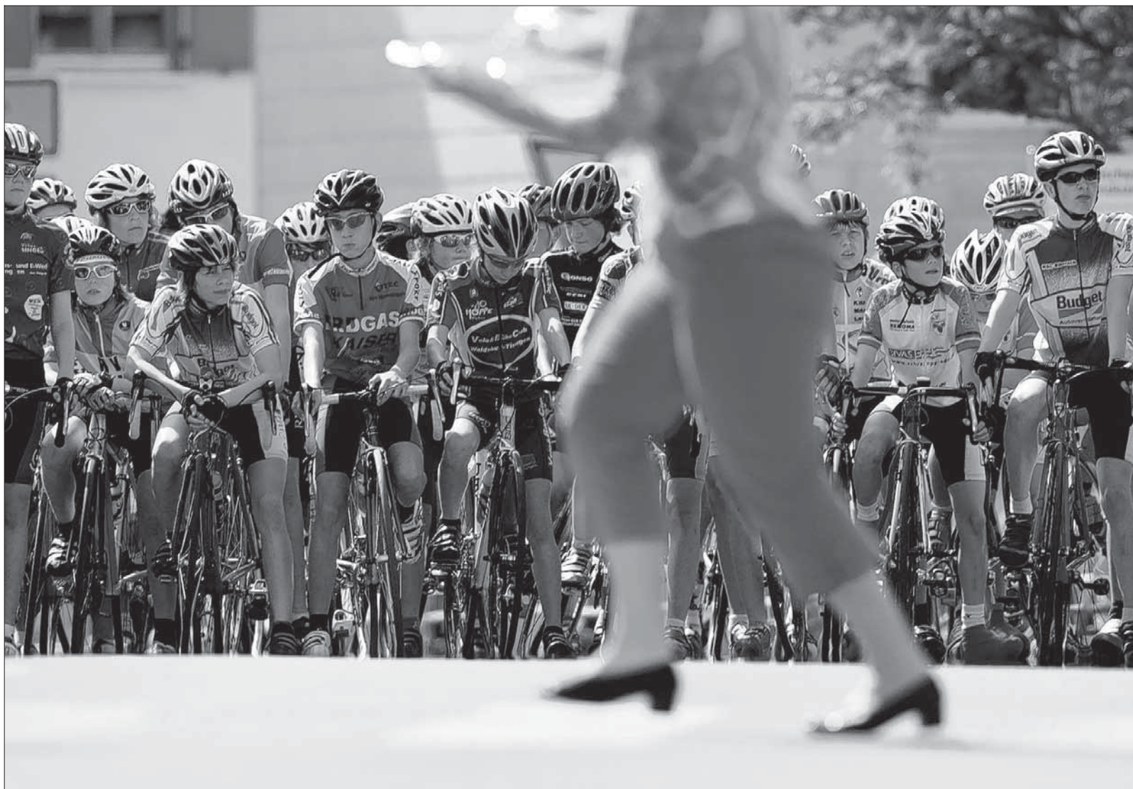
Während die Radportler sich spannende Rennen liefern, können Besucher Kuchen essen, der kurz vor dem Start noch geliefert wird.

Genauso gut haben es auch die Zuschauer am Start und Ziel auf Höhe des Gemeindehauses. Denn entlang der Schweinhausener Straße ist die einzige Möglichkeit für Überholmanöver. Auf der Start- und Ziellinie wird der RSC die Zuschauer, bei kostenlosem Eintritt, versorgen. Ob auch auf dem